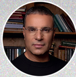
AMIR TSARFATI アミール・ツアルファティ